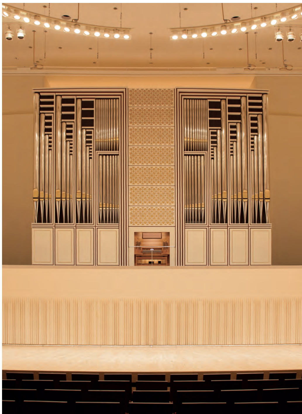
Nasunogahara (JP) Harmony Hall

Spielhilfen: Rieger Setzersystem: 10 Benutzer mit je 1000 Kombinationen mit je 3 Inserts Archiv für 250 Titel mit je 250 Kombinationen 4 Crescendi - einstellbar Sequenzschaltung Kopierfunktion Wiederholungsfunktion Generalabsteller